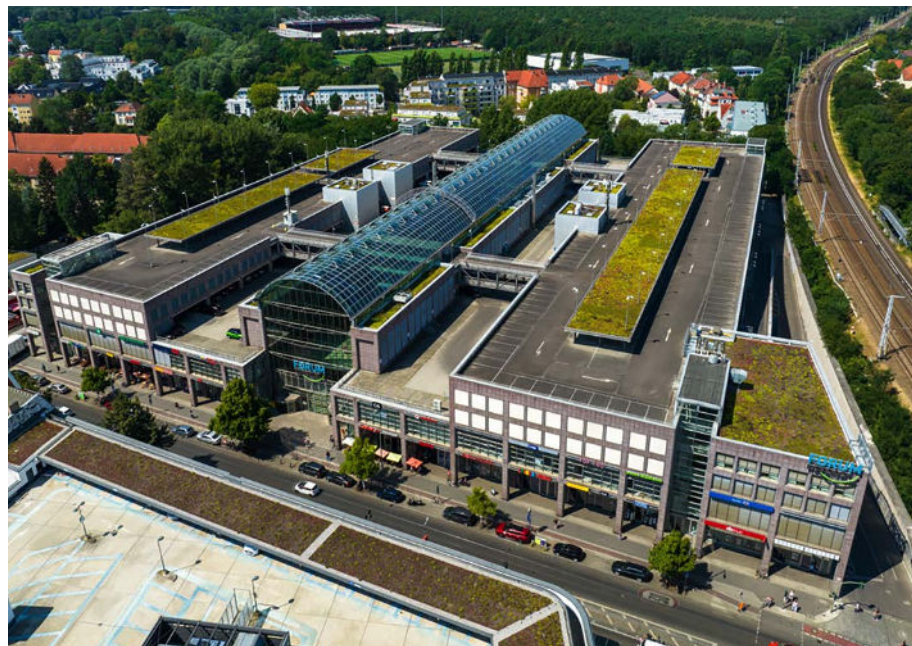
Forum Köpenick: Projektentwicklung, Asset-, Property-, Center Management und Transformation.