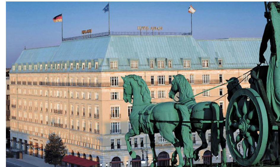
Adlon Berlin: Projektentwicklung, Fondssyndikation, Asset-, Property- und Gebäudemanagement. Foto: Patzschke Architektur