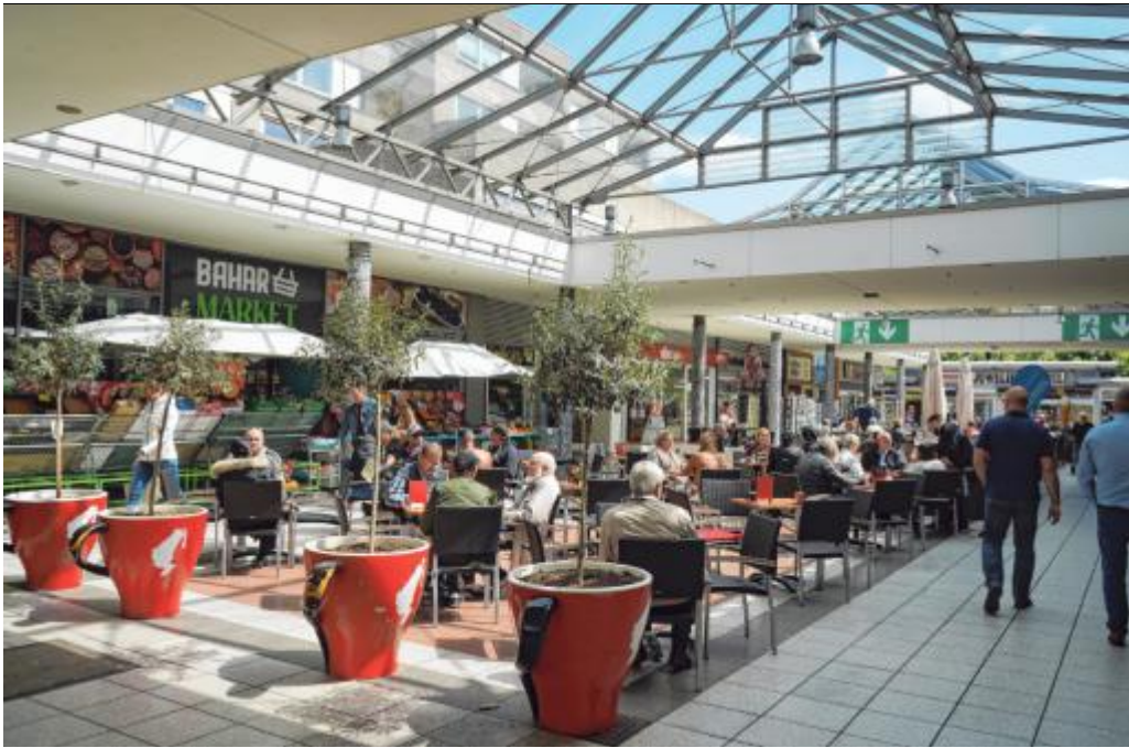
Das moderne Glasdach verleiht dem Siegerlandzentrum Weidenau seinen eigenen, ganz besonderen Charakter.

Das Glasdach über Teilen des Siegerlandzentrums schützt Besucher vor Wind und Wetter