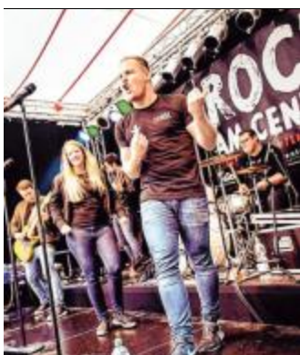
Jedes Jahr ist die Veranstaltung „Rock am Center“ ein Publikumsmagnet.

Wenn es um Rockmusik geht, ist die Veranstaltung „Rock am Center“ in Weidenau ein absoluter Pflichttermin für alle Fans live gespielter Klänge. Jahr für Jahr versammeln sich Hunderte Musikbegeisterte, um bei dieser einzigartigen Freiluft-Veranstaltung mit dabei zu sein. „Rock am Center“ gehört zum Siegerland Center (SIC) einfach dazu.