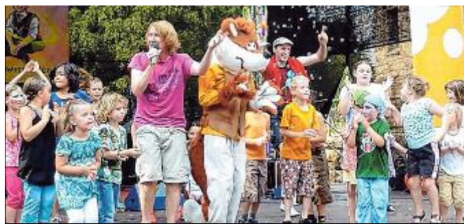
Am Samstag geht es um 14 Uhr bei der Bühnenshow mit „Funny Fux“ äußerst turbulent zu.

ment mit Herz und Sinn für Kinder. Dabei wird er unterstützt durch den liebenswerten „Funny“, den bereits Tausende kleine und große Fans in seinem Plüschkostüm auf der Bühne ins Herz geschlossen haben. Um 15 Uhr erobert dann die Tanzschule Eger mit mitreißenden Choreografien die Bühne, ehe dann um 16 Uhr noch einmal die Show mit „Funny Fux“ erneut Akzente setzen wird. Ab 17.30 Uhr heizt Thomas Frevel mit seiner Musikschulfamilie den Besuchern ordentlich ein. Zwischendurch lockern immer wieder die Auftritte der „Coronette Dancer“, des Kung-Fu-Zentrums Siegen und über den Tag verteilte Walk Acts das Festprogramm auf.