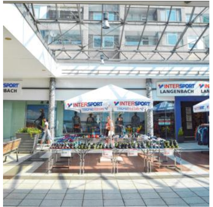
Durch die Dachkonstruktion aus Glas ist das Zentrum stets lichtdurchflutet.

Weidenau. Das Siegerlandzentrum in Weidenau hat sich seit vielen Jahren als ein beliebtes Einkaufsziel etabliert. Eine besondere Attraktion, die dieses Einkaufszentrum auszeichnet, ist seine beeindruckende Glasdach-Konstruktion. Mit Hilfe dieser im Jahr 2001 installierten architektonischen Lösung wurde eine einladende Atmosphäre geschaffen.