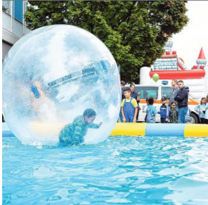
Ein echter Sommerspaß: Das SIC-Kinderfest begeistert auch wieder am 3. Juni seine Besucher.