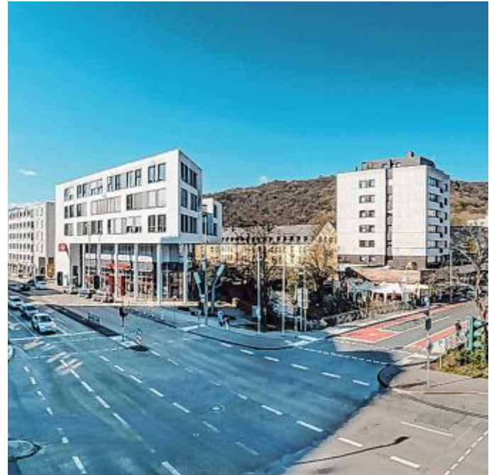
Gerade auch die aktuellsten baulichen Veränderungen haben dem Stadtteil sehr gut getan.

Muth, BettenBlecher sorgen für einen hohen Bekanntheitsgrad, Fachkompetenz, Dienstleistungsqualität und Frequenz.