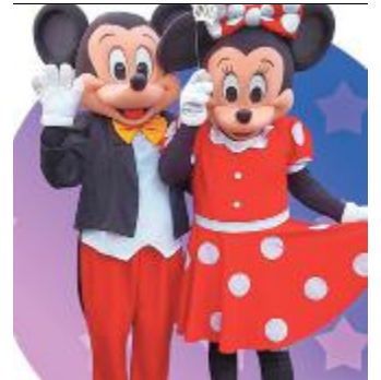
Mickey und Minnie sind als Walk Acts unterwegs.