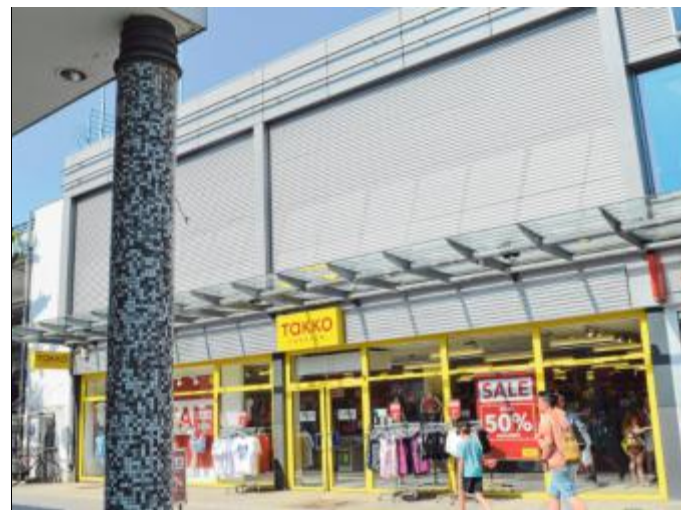
Ungetrübter Einkaufsspaß wird auch durch die gläsernen Vordächer mancher Geschäfte in Weidenau möglich.

kaufsoffenen Sonntage finden unter dem Dach statt und ziehen regelmäßig zahlreiche Besucher an. Ein weiterer Vorteil