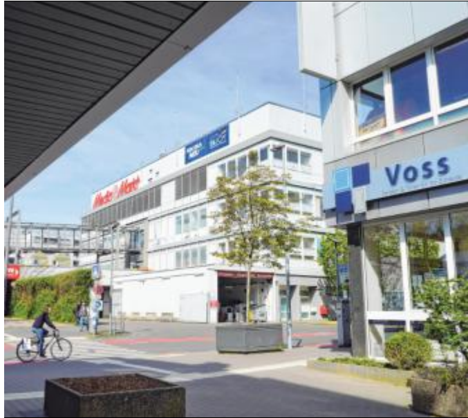
Das Siegerland Center Weidenau (SIC) ist fester Bestandteil des Einkaufszentrums.

Dabei gelte es gerade in der heutigen Zeit, viele Herausforderungen zu meistern. „Einen gesunden Branchenmix anbieten zu können, das ist schon herausfordernd. Die gesunde Balance zwischen Händlern und Kunden muss gewährleistet sein. Für jede Altersgruppe attraktiv und interessant zu sein – und auch zu bleiben – ist unser Ziel“, so der Centermanager. Der Zusammenhalt innerhalb der Mietergemeinschaft sei sehr gut, so Van den Bril weiter, es werde sich gegenseitig unterstützt, denn