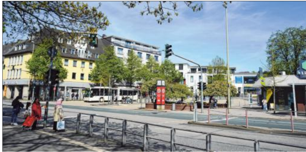
In Weidenau kann man nicht nur gut leben, sondern auch arbeiten und studieren. Von Vorteil ist die überaus gute Verkehrsanbindung.

Einer der großen Vorzüge von Weidenau ist die gute Verkehrsanbindung. Die Hüttentalstraße (HTS) und der Zug- und Busbahnhof bieten eine schnelle und bequeme Anbindung an die umliegenden Städte, beziehungsweise Stadtteile. So erreicht man beispielsweise die Siegener Innenstadt in nur wenigen Minuten. Weidenau punktet allem voran auch mit dem Siegerlandzentrum. Hier findet sich eine Vielzahl von Geschäften, Restaurants und Cafés, die zum Bummeln und Verweilen einladen. Das Einkaufszentrum ist nicht nur ein wichtiger Anlaufpunkt für Einwohner, sondern zieht auch Besucher aus der Region und darüber hinaus an. Neben dem Siegerlandzentrum gibt es in Weidenau auch traditionsreiche Unternehmen,