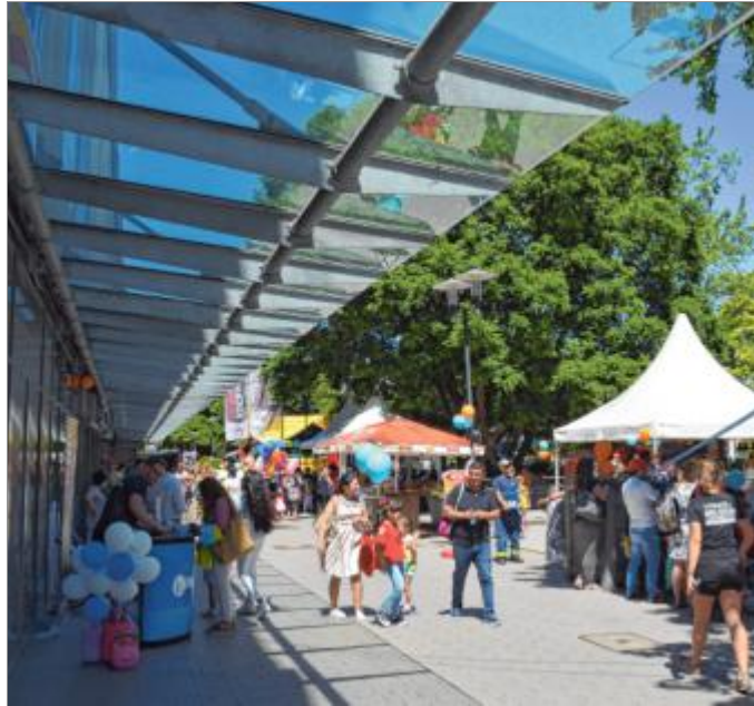
Neben guten Einkaufs-Erlebnissen begeistert das SIC auch mit tollen Events.

► Der SIC-Gutschein: Zudem bietet das Siegerland Center Weidenau das ideale Geschenk für alle Altersklassen und für jeden Geschmack an: den so genannten SIC-Gutschein. „Damit machen Sie dem Beschenkten garantiert eine Freude“, so