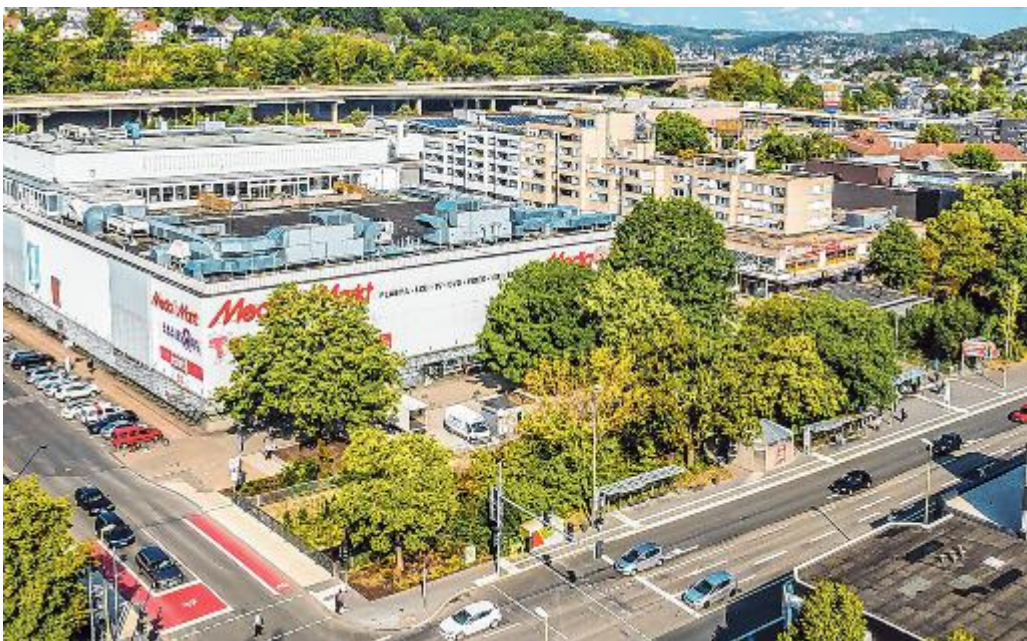
Das Siegerlandzentrum Weidenau schaut jetzt auf ein halbes Jahrhundert voller Einkaufsvergnügen, Begegnungen und Erlebnisse zurück.