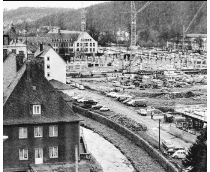
In aufwendigen Baumaßnahmen hat sich der Stadtteil immer wieder weiterentwickelt.

► Wichtige Bestandteile des Zentrums waren und sind die Bismarckhalle, das Hallenbad und viele Unternehmen aus dem Dienstleistungs- und produzierenden Sektor.