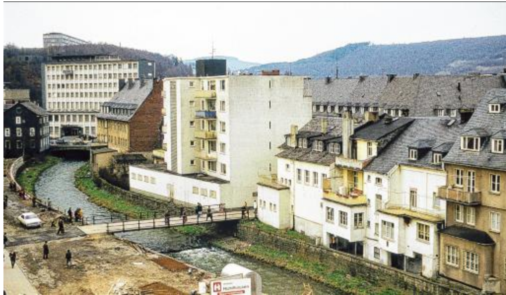
Nach und nach wurde der Standort immer weiter aufgewertet und modernisiert.

► Nach Konkurs der Firma Achenbach Metalltechnik, Bismarckstraße 12, soll das Grundstück einer neuen städtebaulichen Nutzung zuge-