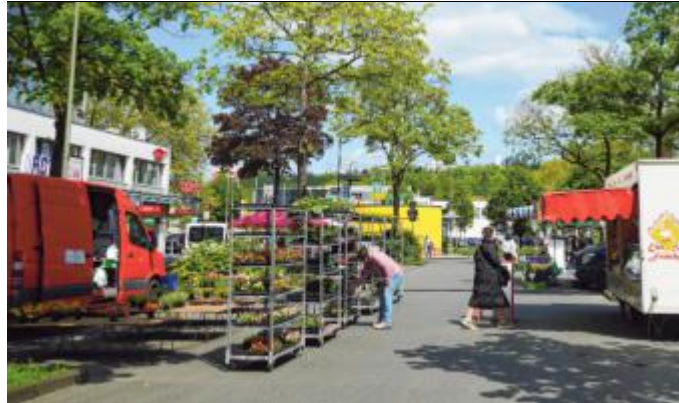
Die zentrale Lage ermöglicht es den Besuchern, den Weidenauer Wochenmarkt bequem zu erreichen.

An jedem Mittwoch und Samstagvormittag, jeweils von 7 bis 13 Uhr (außer an Feiertagen), bietet er nicht nur ein breites Sortiment an regionalen frischen Speisen, sondern auch einen Treffpunkt für alle Generationen. Der Standort im Ein-