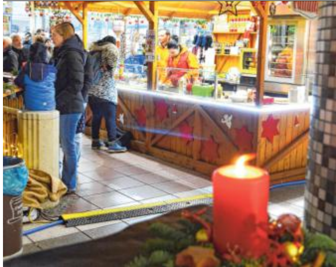
Der Weidenauer Weihnachtsmarkt im Siegerlandzentrum hat Tradition.

Neben den traditionellen Leckereien wie gebrannte Mandeln, Lebkuchen und Glühwein gibt es auf dem Weihnachts-