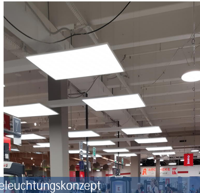
Impressionen neues Beleuchtungskonzept